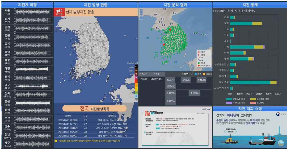
〈지진감지영상 실시간 스트리밍 화면〉