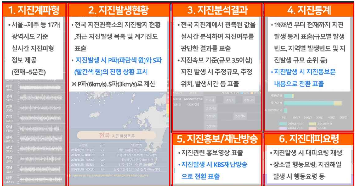
〈지진감지영상 화면 내용 설명〉