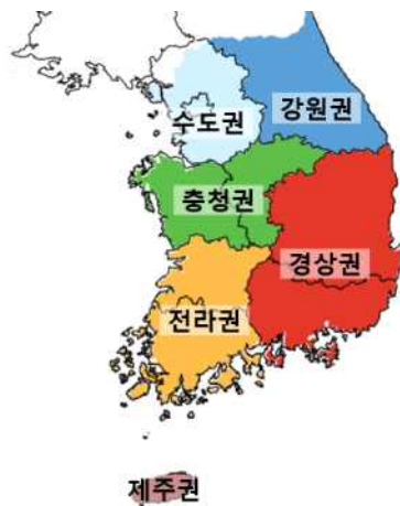
그림 1-1. 남한지역 6개 권역 구분