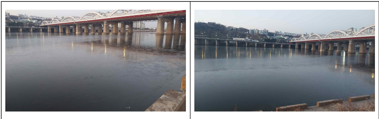
[그림 1] 한강 결빙 관측 사진(2024. 1. 26. 08시경)