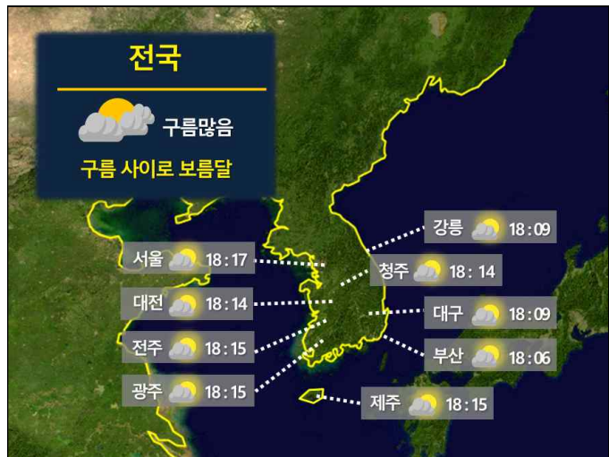
[ 9월 17일(화) 전국 월출 시각 ]