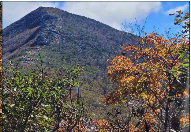
중청대피소에서 바라본 대청봉

□ 올해 속초 지역의 9월 중순 이후(9.11.~10.4.) 일평균 최저기온은 17.6℃로 평년(15.2℃)보다 크게 높았으며, 설악산 관측지점의 9월 일평균 최저기온은 11.6℃로 작년(10.4℃)보다 높아 단풍이 평년보다 늦게 시작되었다.