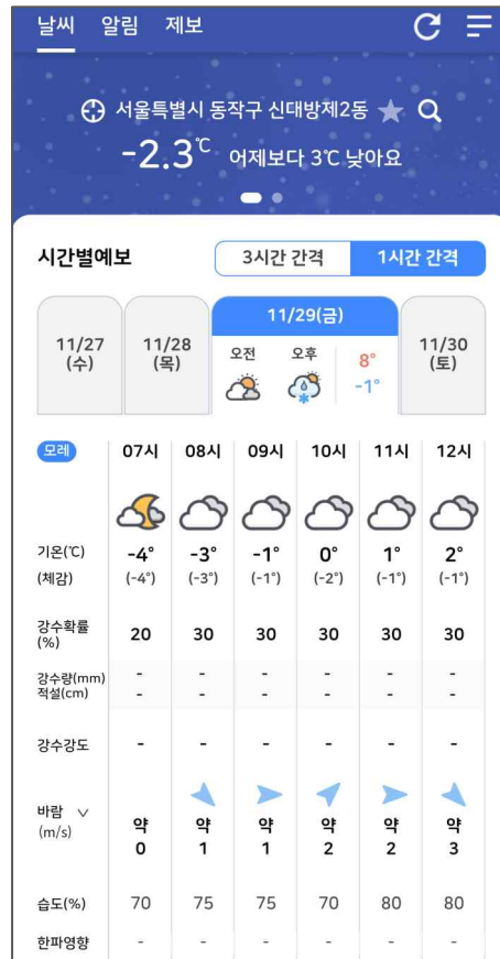
< 날씨알리미 예시 (좌) 3시간 간격, (우) 1시간 간격 >