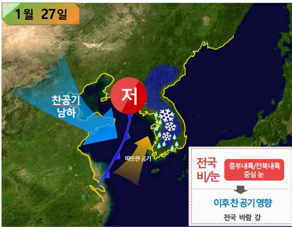
[ 27일 기압계 모식도 ]