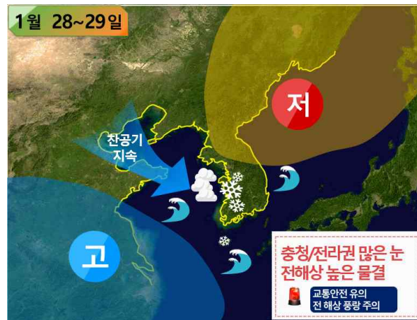
[ 28~29일 기압계 모식도 ]