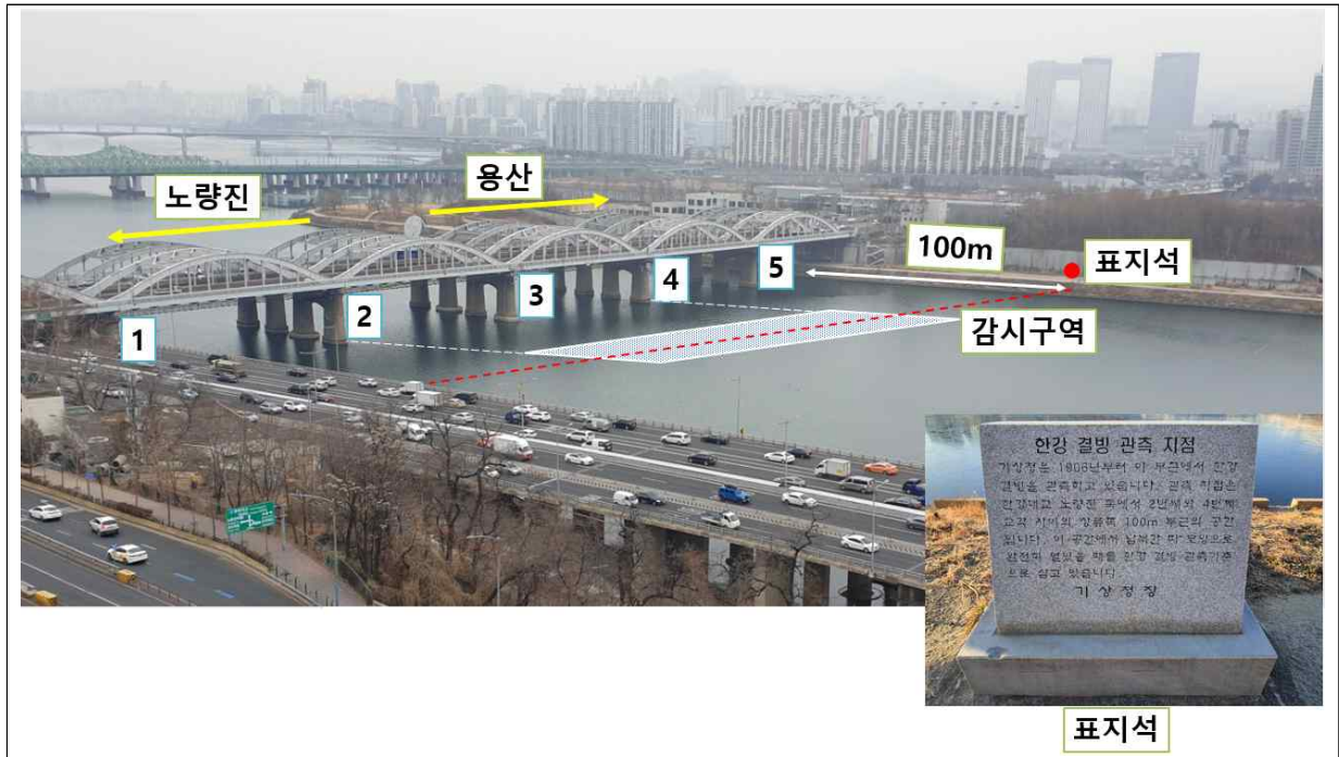
[그림 2] 한강 결빙 관측 장소