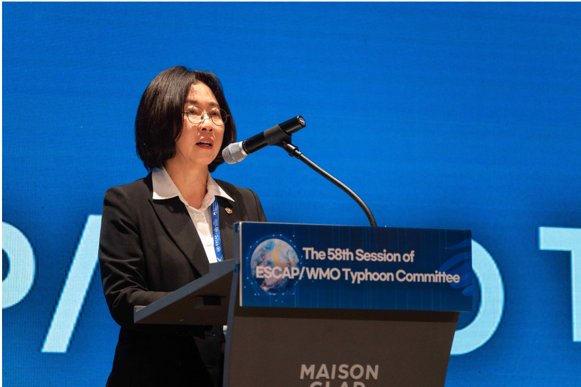
| 환영사 |