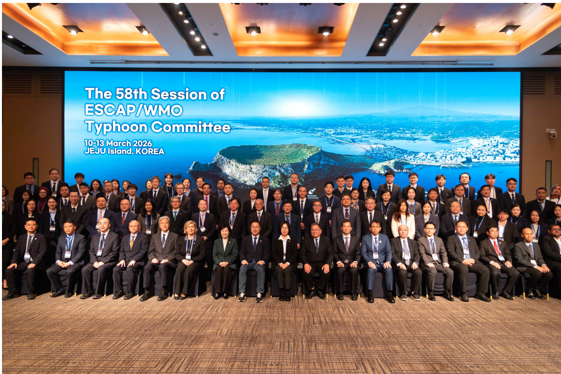
| 단체사진 |