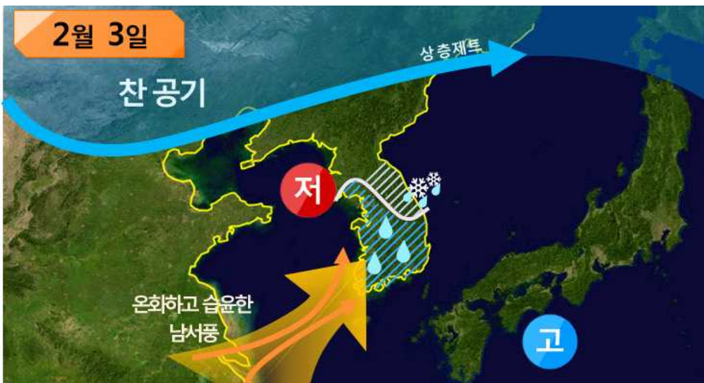
<2월 3일(일) 예상기압계 모식도>