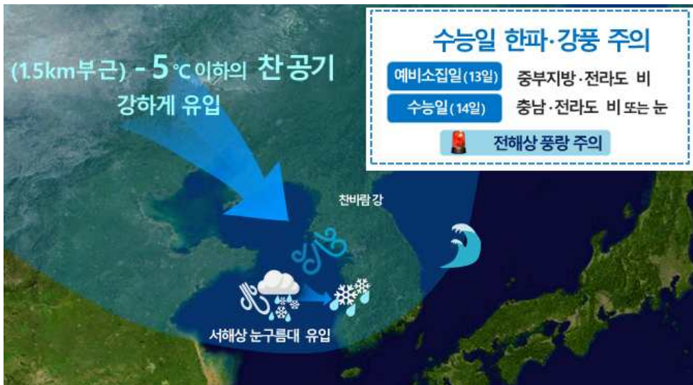
[11월 14일(수능 당일) 기압계 모식도]

2020학년도 대학수학능력시험일(14일) 기상전망 ○ 13일 오후~밤 중부지방과 전라도 비, 14일 충청도, 전라도 비/눈 ○ 13일 오후~14일, 중부지방 중심 기온 큰 폭으로 떨어져 - 14일 서울 아침 최저기온 영하 2도 등 수능한파 유의 - 전국 강한 바람, 체감온도 5~10도 가량 낮아 더욱 춥겠음