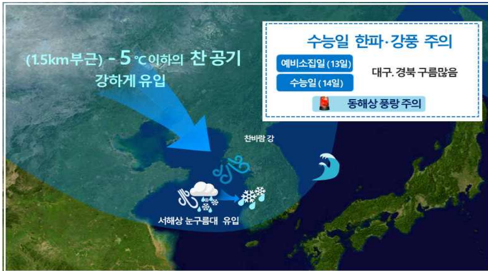
[11월 14일(수능 당일) 기압계 모식도]

2020학년도 대학수학능력시험일(14일) 기상전망 ○ 13일 오후~14일, 경북내륙 중심 기온 큰 폭으로 떨어져 - 14일 대구 아침 최저기온 4도 등 수능한파 유의 - 강한 바람, 체감온도 5~10도 가량 낮아 더욱 춥겠음