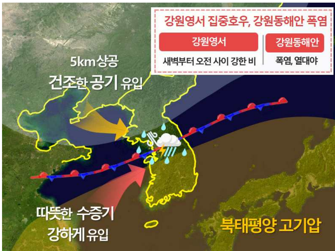
[ 8월 2일 새벽 기압계 모식도 ]