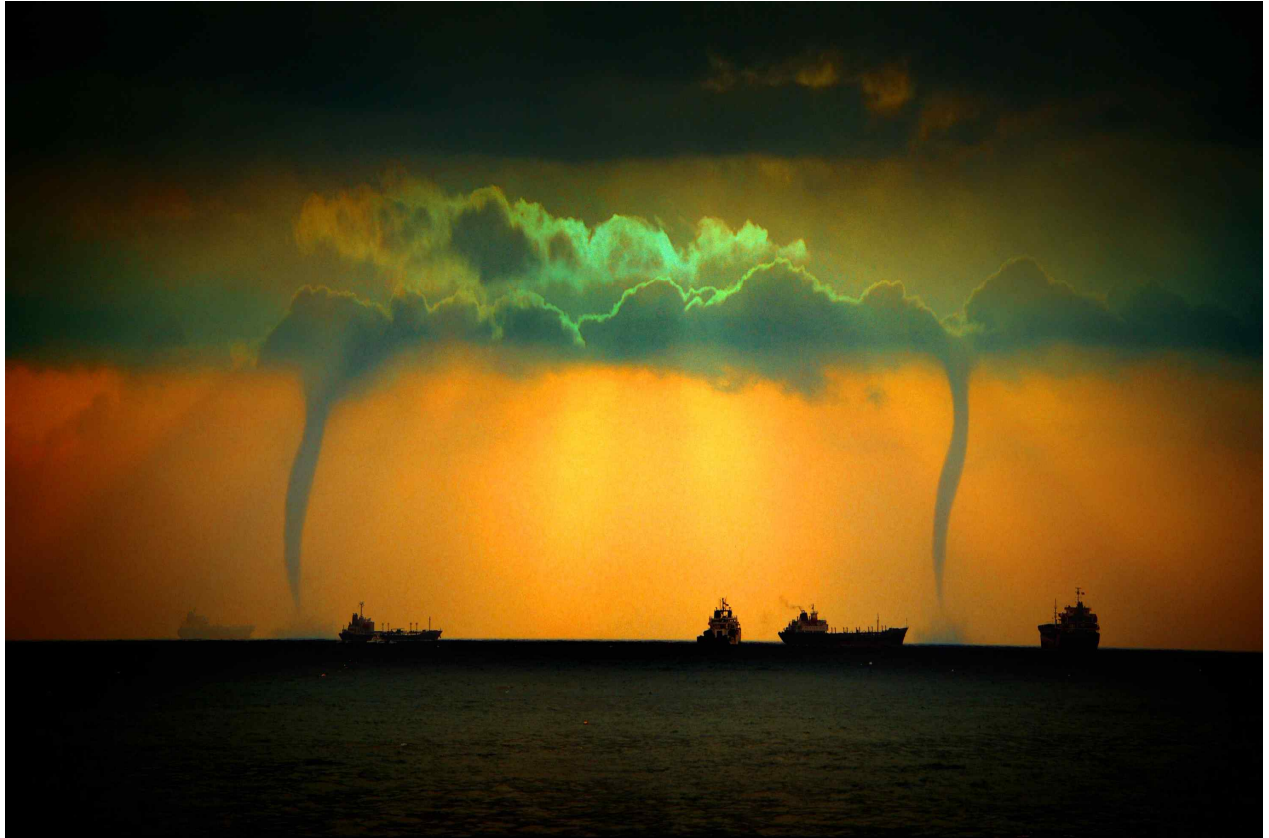
[대상] 쌍용오름 / 김택수 作