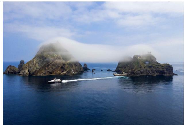
[은상] 구름 모자 쓴 독도 / 우태하 作