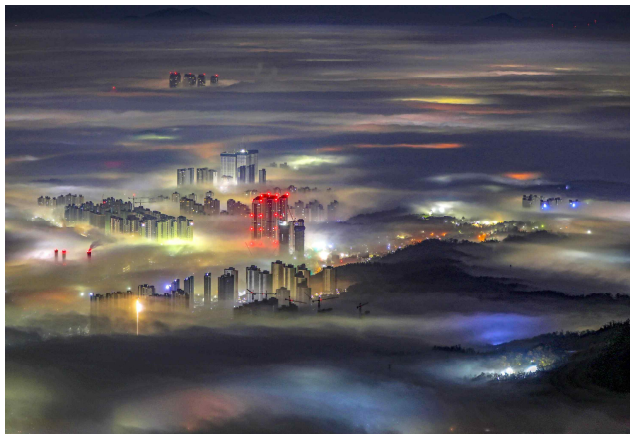
[금상] 안개도시 / 방춘성 作