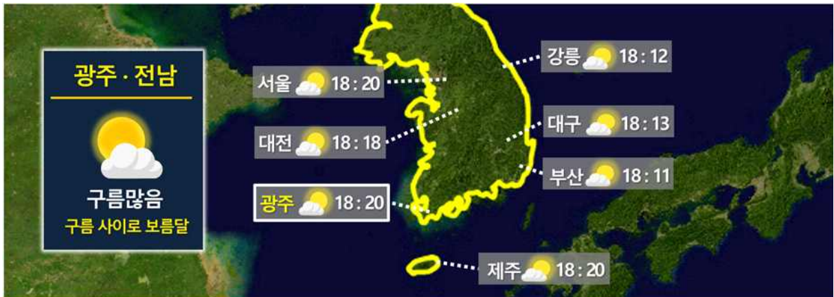
[ 10월 1일(목) 광주 월출 시각 ]