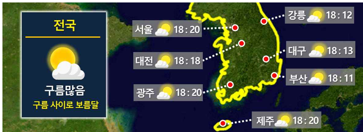
[ 10월 1일(목) 전국 월출 시각 ]