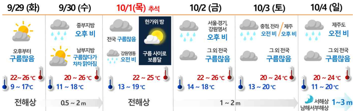
[ 추석 연휴 날씨 요약 ]