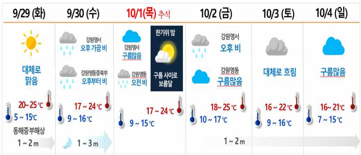
[ 추석 연휴 날씨 요약 ]