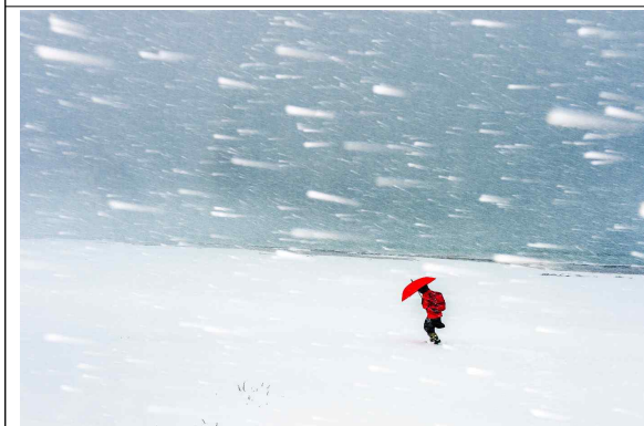
[입선] 올레길 폭설 속에서