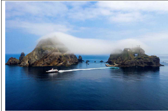
[은상] 구름모자 쓴 독도