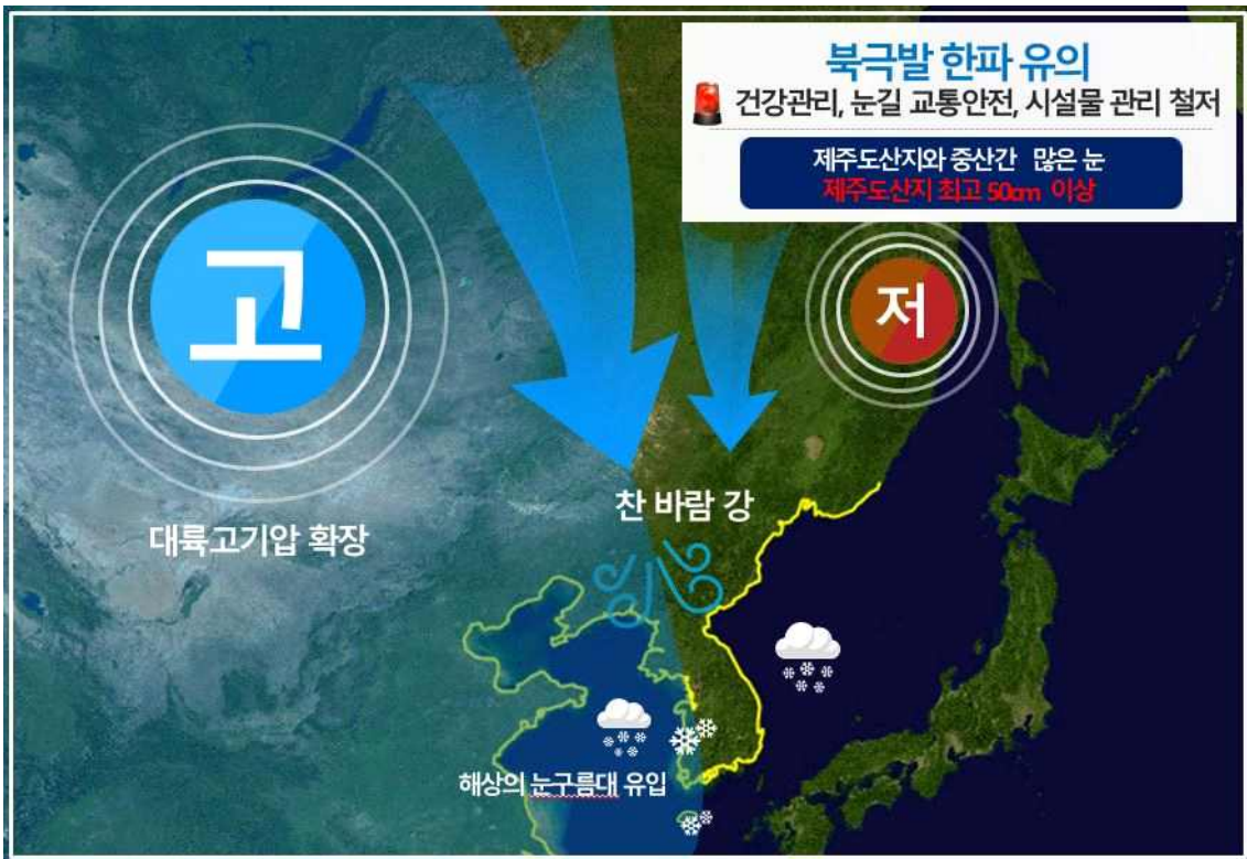
[ 1월 7일 오후 예상기압계 모식도 ]

북극발 한파 영향, 이번 주 강추위 이어져 ○ 이번 주 내내 강추위, 체감온도 더욱 낮아 - 7~9일 영하 내외로 떨어지는 등 이번 한파 고비 - 눈길 교통안전, 비닐하우스 등 시설물 피해와 한랭 질환에 대비 필요 ○ 이번 주(6~10일) 제주도 눈 - 6~10일 제주도산지 최대 50cm 이상 많은 눈 주의