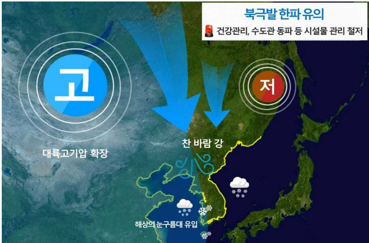
[ 1월 7일 오후 예상기압계 모식도 ]