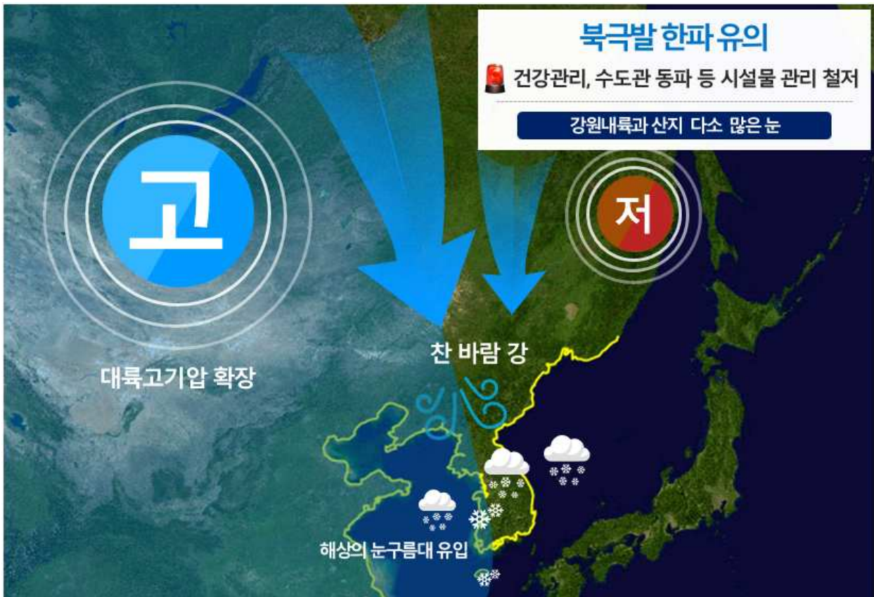
[ 1월 7일 새벽 예상기압계 모식도 ]