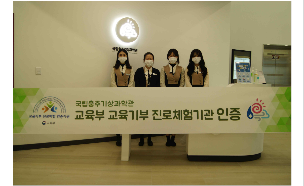
<교육부 우수 진로체험기관 인증>