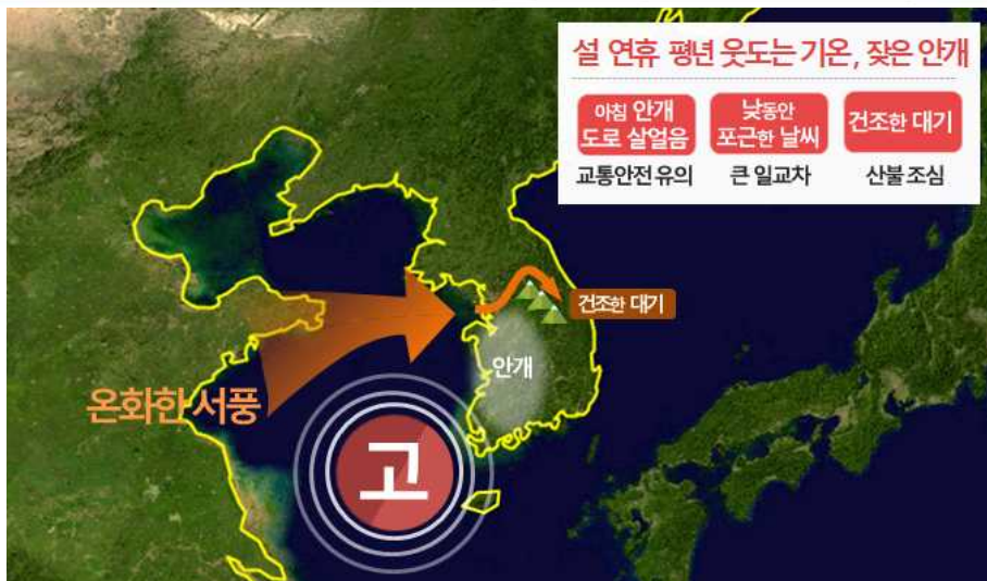
[ (위) 연휴기간 날씨 요약 (아래) 10~13일 우리나라 주변 기압계 모식도 ]