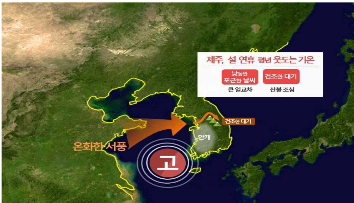
[ (위) 연휴기간 날씨 요약 (아래) 10~13일 우리나라 주변 기압계 모식도 ]