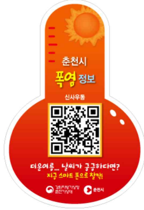
폭염정보 QR코드 스티커 예시(춘천시 신사우동)