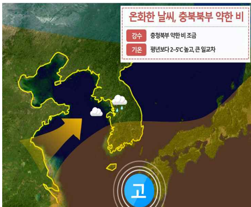
[ 10월 17일 기압계 모식도 ]