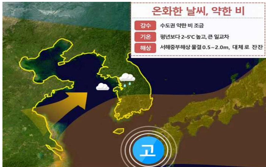
[ 11월 18일(목) 예상기압계 모식도 ]