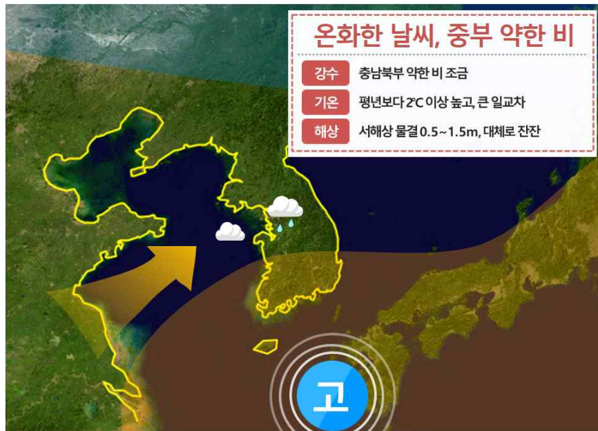
[ 11월 18일(목) 기압계 모식도 ]