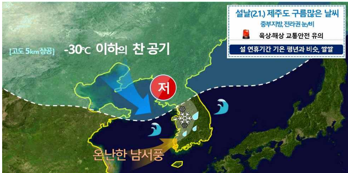
[ 설날(2.1.) 기압계 모식도 ]