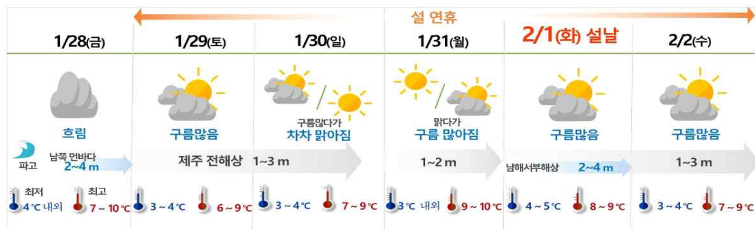
[ 설 연휴 날씨 요약 ]