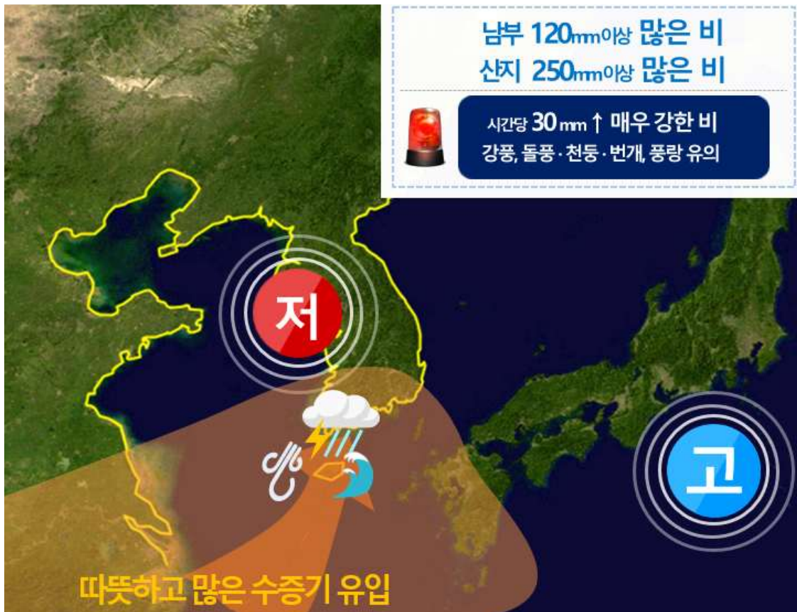
[ 3월 26일 새벽 기압계 모식도 ]