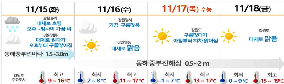
[ 11월 15~18일 날씨예보 요약 ]

□ 강원지방기상청(청장 박 훈)은 2023학년도 대학수학능력시험(이하 수능)일은 대체로 맑은 날씨와 함께 평년 수준과 비슷하거나 조금 높은 기온 분포를 보이며 수능 한파는 없을 것으로 전망하고, 수험생의 건강 관리와 시험장 이동지원을 위한 상세한 기상 전망(11월 15~18일)을 발표하였다.