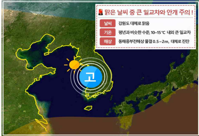
[ 11월 17일(목) 예상기압계 모식도 ]