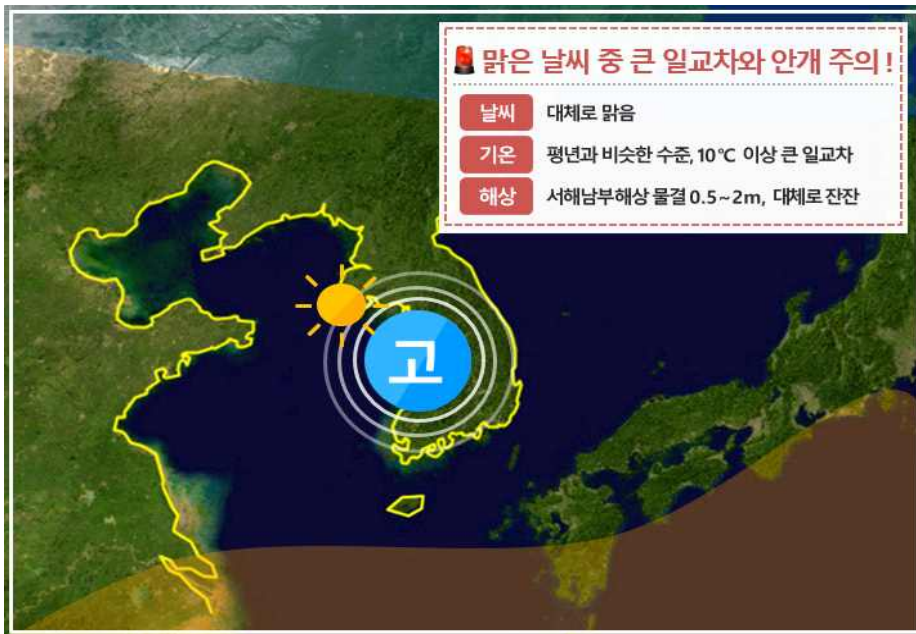
[ 11월 17일(목) 예상기압계 모식도 ]