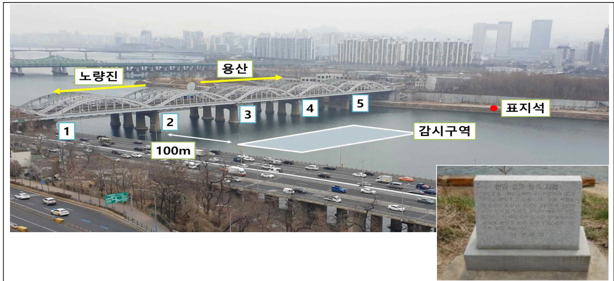
[그림 2] 한강 결빙 관측 장소