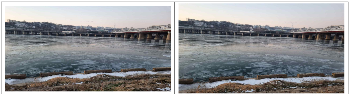
[그림 1] 한강 결빙 관측 사진(2022.12.25. 08시경)