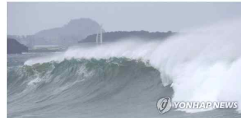
침수된 공터에는 비도

(제주=연합뉴스) 김민정 기자 = 제10호 태풍 하이선의 영향으로 제주가 7일 밤 한때에는, 도로 표지판이 밀려버려 소용돌이치는 모습이 포착됐다. 2020년 9월 7일 오전 10시 30분 현재 모습. 연합뉴스 김민정 기자