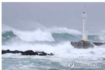
태풍의 영향으로 강한 비바람이 쏟아지고 있다.

6일 오후 11시 기준 지점별 최대순간풍속은 한림산 남쪽 초속 29.0m, 뽕새오름 28.6m, 서별오름 26.7m, 지귀도 23.9m, 성산산성 20.3m 등이다.