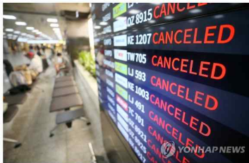
태풍 북상에 제주공항 열람

(제주=연합뉴스) 변지철 기자 = 제10호 태풍 하이선의 영향으로 '태풍의 길목' 제주와 하늘길 바닷길 모두 끊겼다.