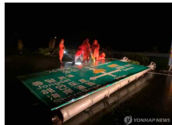
태풍 강풍에 밀려버려진 도로 표지판

(제주=연합뉴스) 김민정 기자 = 제10호 태풍 하이선의 영향으로 제주가 7일 밤 한때에는, 도로 표지판이 밀려버려 소용돌이치는 모습이 포착됐다. 2020년 9월 7일 오전 10시 30분 현재 모습. 연합뉴스 김민정 기자