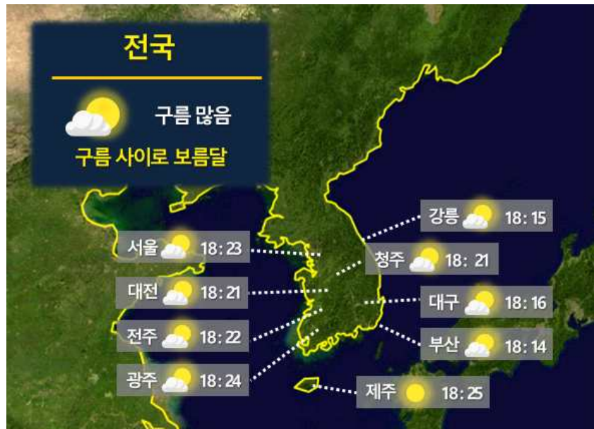
[ 9월 29일(금) 전국 월출 시각 ]