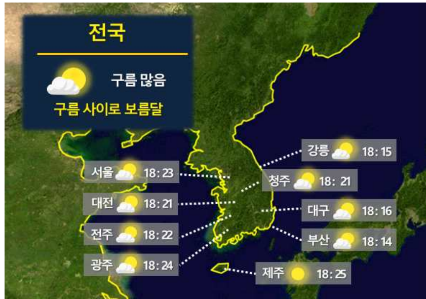
[ 9월 29일(금) 전국 월출 시각 ]