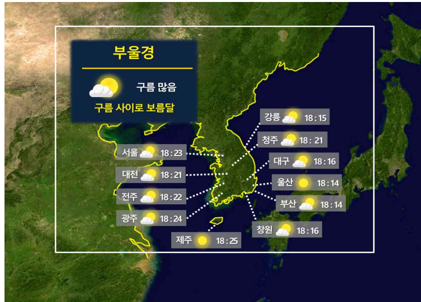
[ 9월 29일(금) 전국 월출 시각 ]