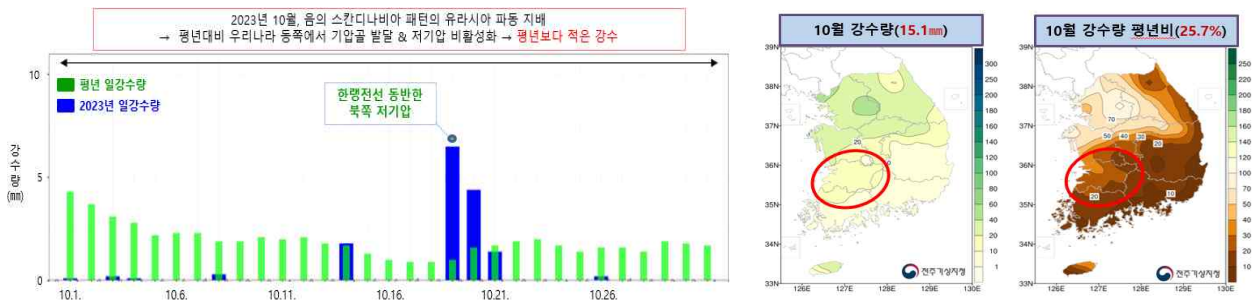
[그림 2] 2023년 10월 전라북도 강수량 일별 시계열(좌) 및 월누적 분포도(우)