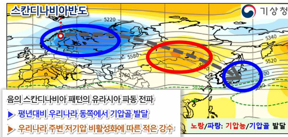
[그림 3] 2023년 10월 적은 강수 관련 유라시아 기압계 모식도