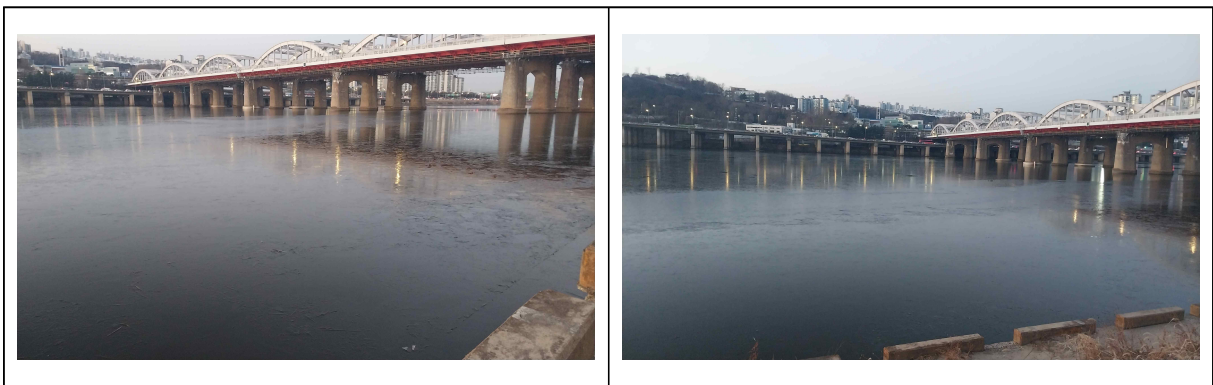
[그림 1] 한강 결빙 관측 사진(2024. 1. 26. 08시경)