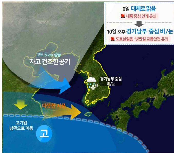
<설 연휴 기압계 모식도>