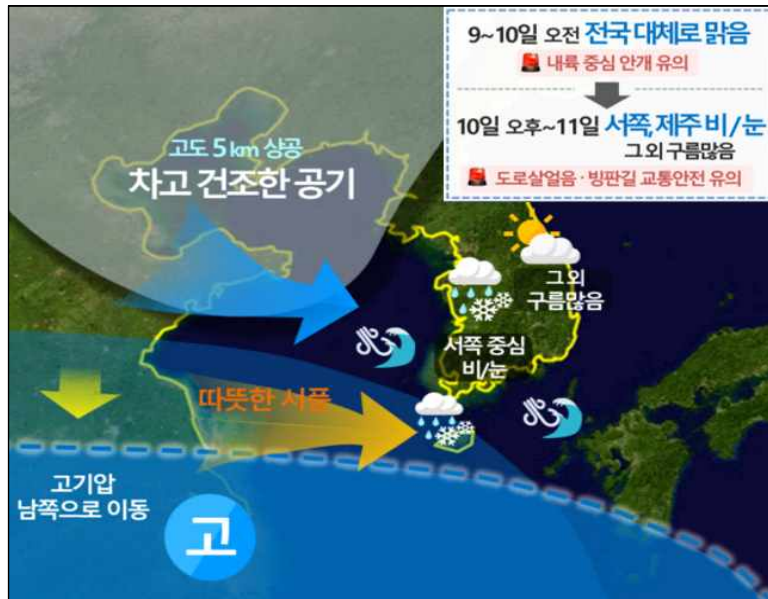
[ 설 연휴 전국 기압계 모식도 ]