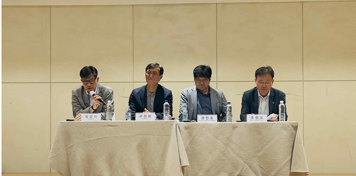
2024년 부산기후변화포럼 패널토론 모습 (2024년 6월 25일, 국제빌딩 양정 5층 연회장)

일시: 2024. 6. 25(화) 14:00 장소: 국제빌딩 양정 5층 연회장 부산광역시 부산지방기상청 BDI 부산연구원