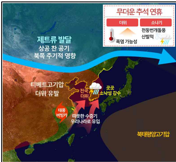
[ 기압계 모식도 ]