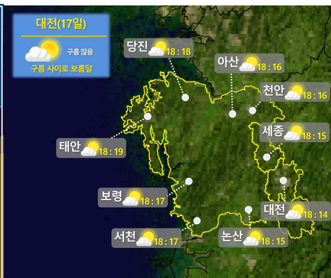
< 9월 17일(화) 충남권 월출 시각 >