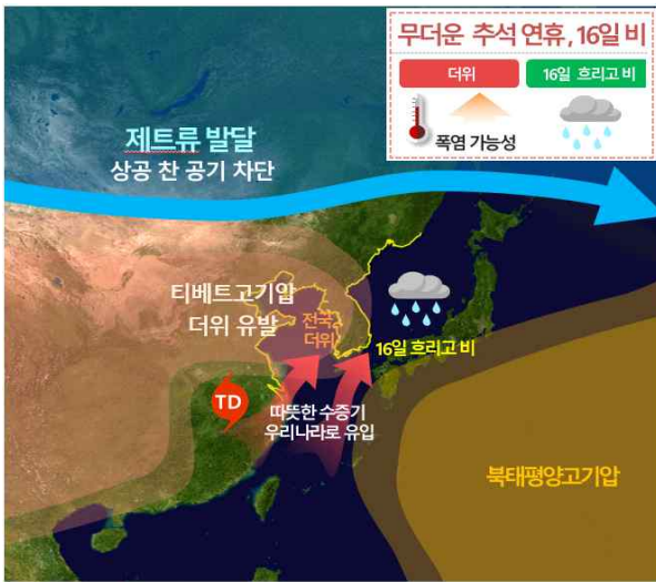
[ 기압계 모식도 ]