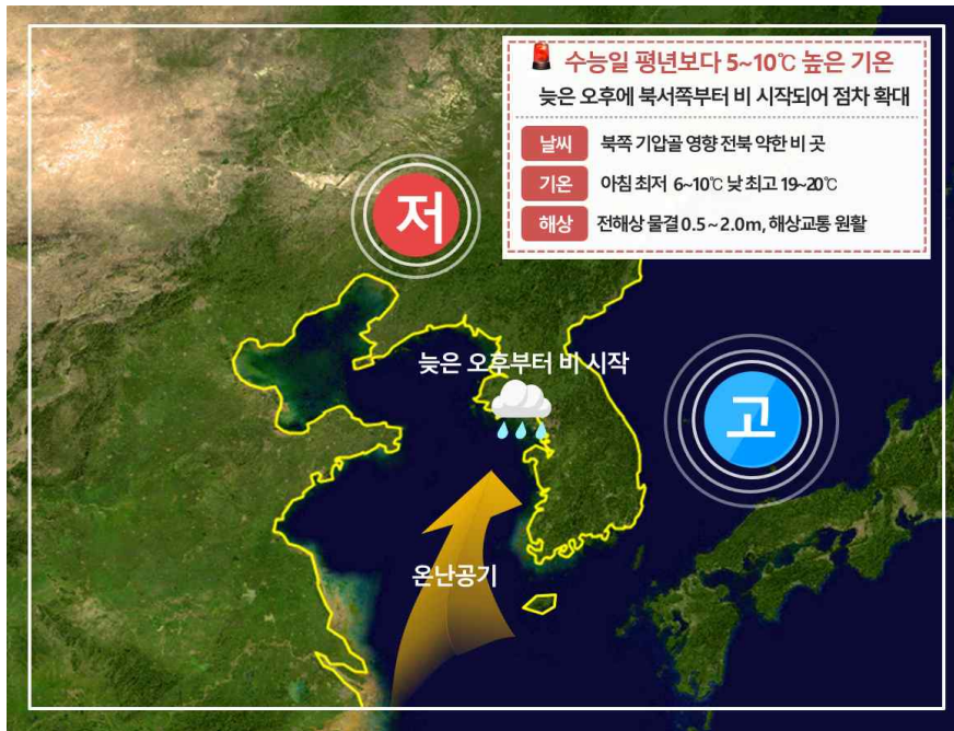
[ 11월 14일 기압계 모식도 ]