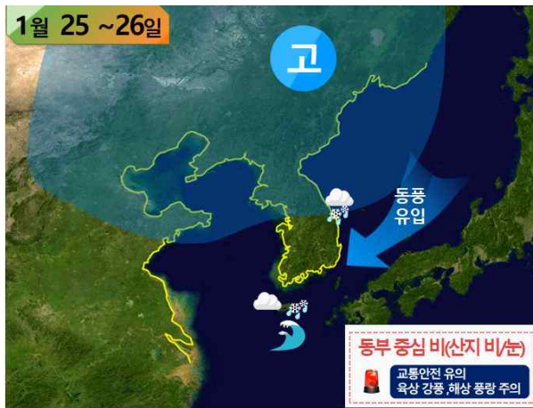
[ 25~26일 기압계 모식도 ]