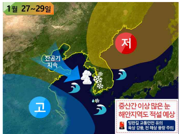
[ 27~29일 기압계 모식도 ]