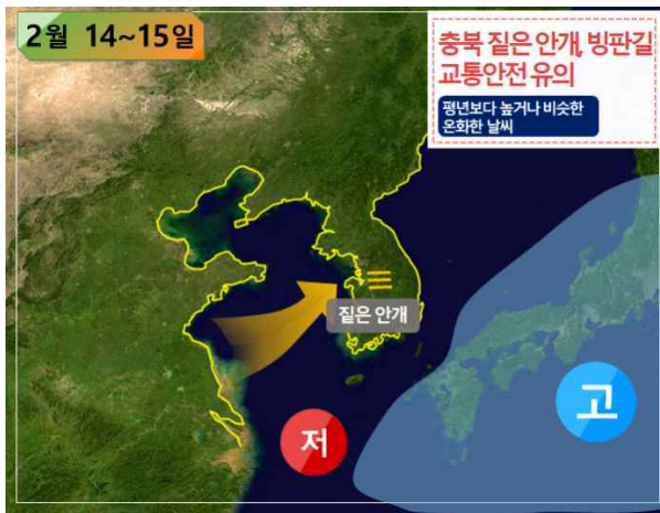
[ 14~15일 기압계 모식도 ]