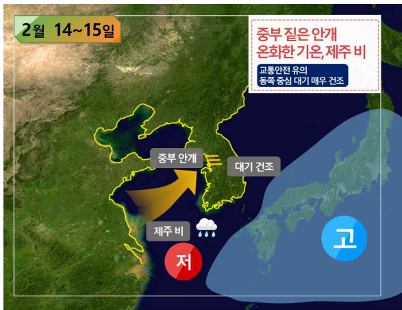
[ 14~15일 기압계 모식도 ]