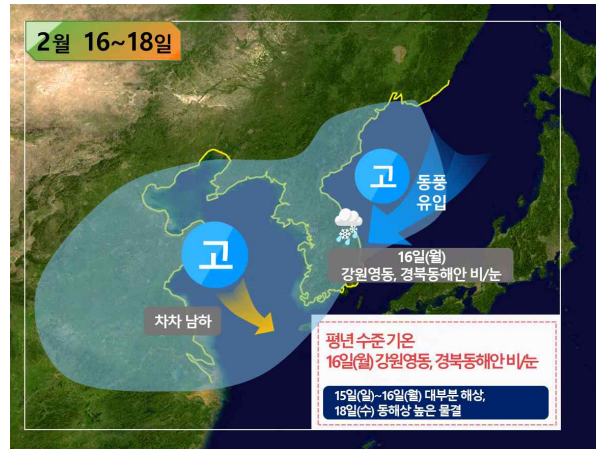
[ 16~18일 기압계 모식도 ]